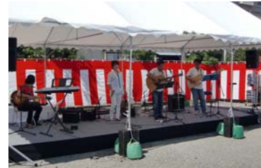
「イノシズ」によるフォークコンサート。