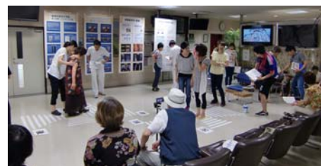
初めての試み。リハビリテーション部による体験コーナー。