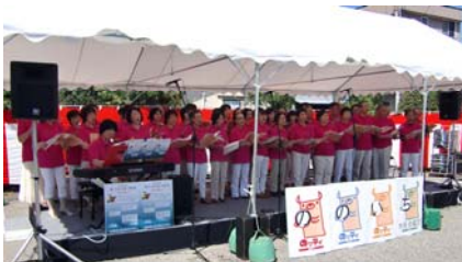
野々市市民合唱団によるオープニング。