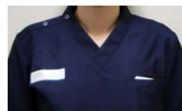
リハビリテーション(理学療法士・作業療法士)