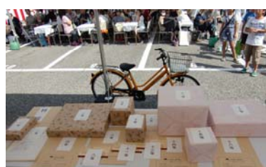
豪華抽選会の商品の数々。