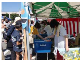
模擬店はどこも大人気！