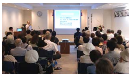
宮崎院長による講演、「転倒とロコモティブシンドローム」の様子。