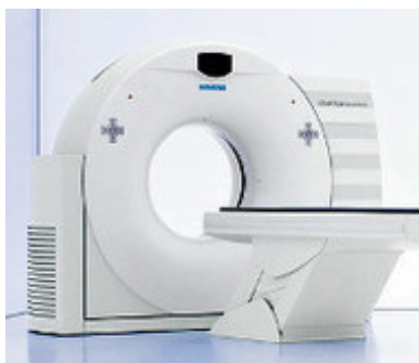
マルチスライス CT (エモーション 16)