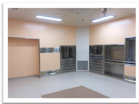
手術室は3室あります